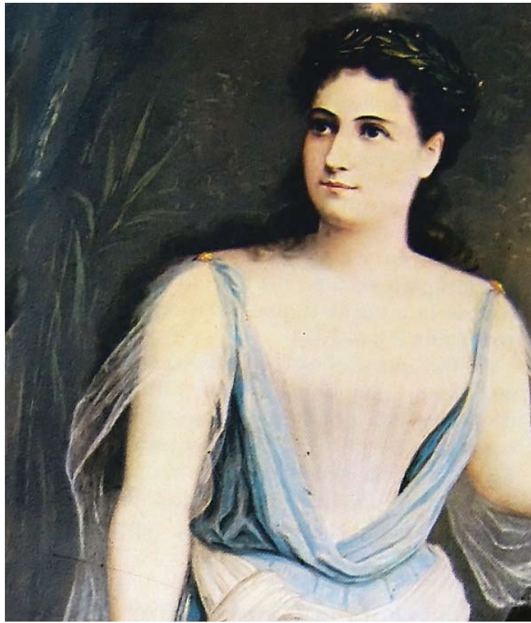
Retrato de Manuela Sáenz.