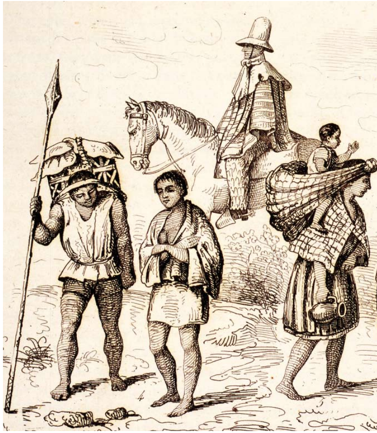
Habitantes del campo.