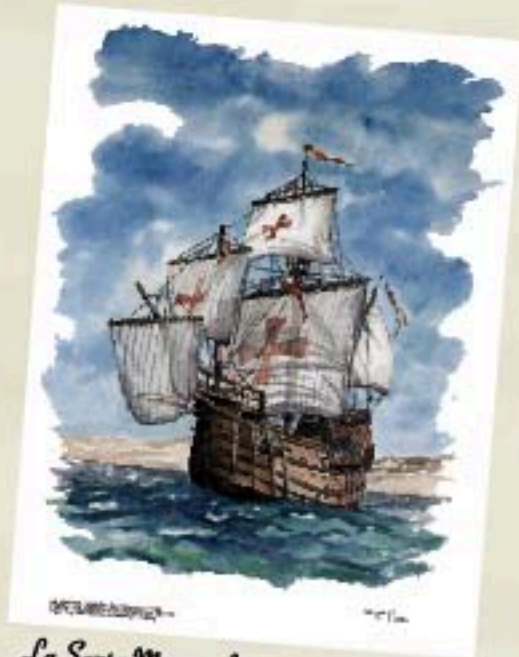
La Santa Maria - Interpretación artística