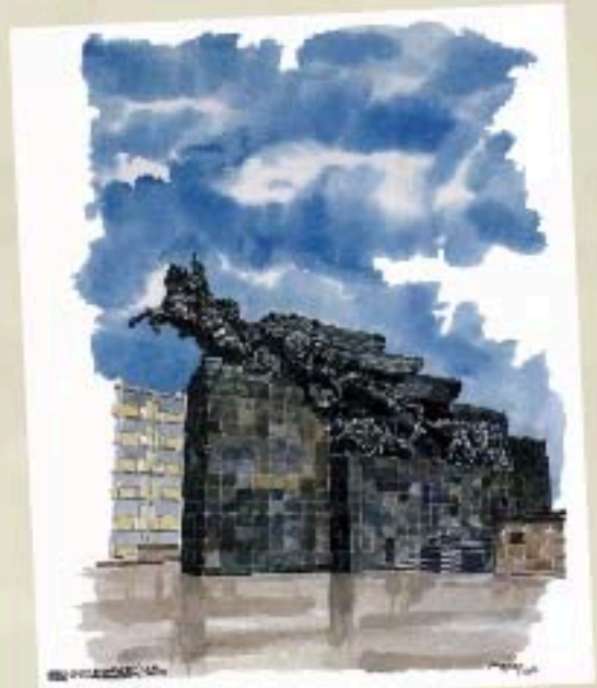
Monumento a Bolívar - Quito - Ecuador