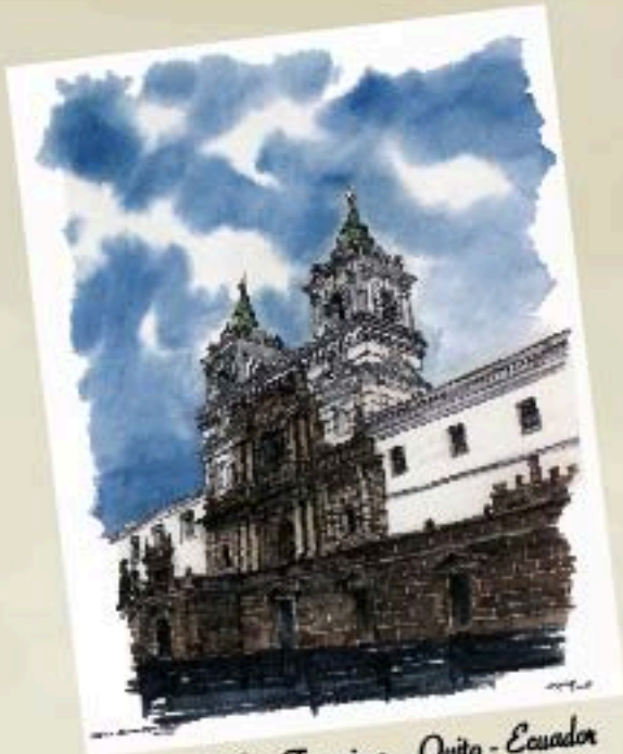
Iglesia de San Francisco - Quito - Ecuador